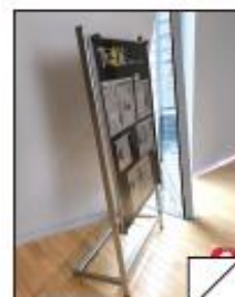
墨田区 すみだ北斎美術館