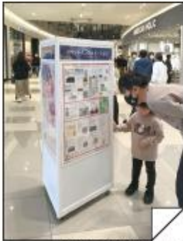
柏市 セブンアリオ柏