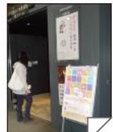
東京国際フォーラム 相田みつを美術館