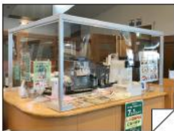
白井市 しろいの湯