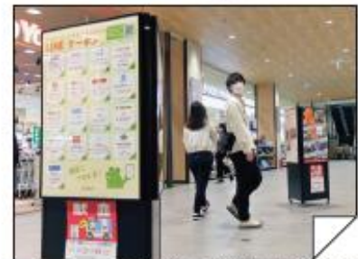
八千代市 フルルガーデン八千代