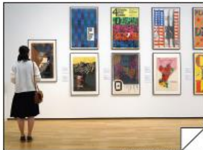
神奈川県立近代美術館