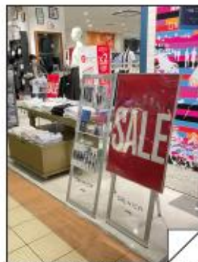
流山市 流山おおたかの森 S・C