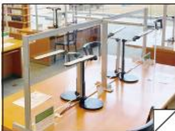
成田市立図書館本館（別館にもあります）