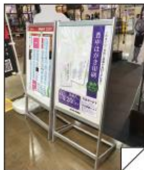
ジョイフル本田千葉ニュータウン店 ジョイフル2