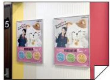
船橋市 カラオケ店