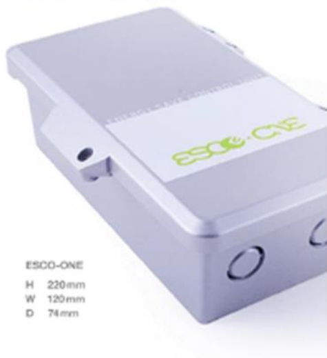
ESCO-ONE H 220mm W 120mm D 74mm

業務用エアコン・冷凍庫・冷蔵庫のコンプレッサーの稼働状況を監視し、最適なタイミングで省エネ制御を致します。環境変化を起こさず、施設を快適性を維持しながら、消費電力の削減が可能。